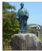
東行庵(高杉晋作像)