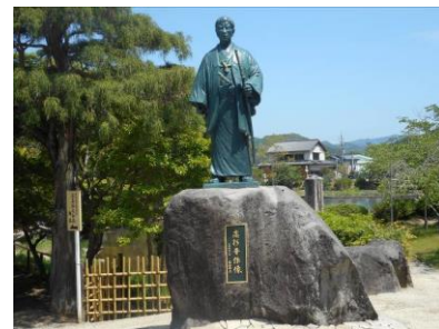
東行庵（スタート地点）の高杉晋作像